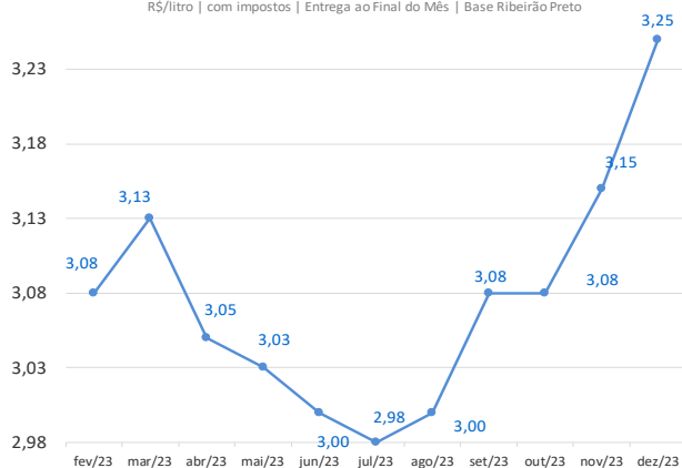
Curva de Preços Futuros NY

R$/litro | com impostos | Entrega ao Final do Mês | Base Ribeirão Preto